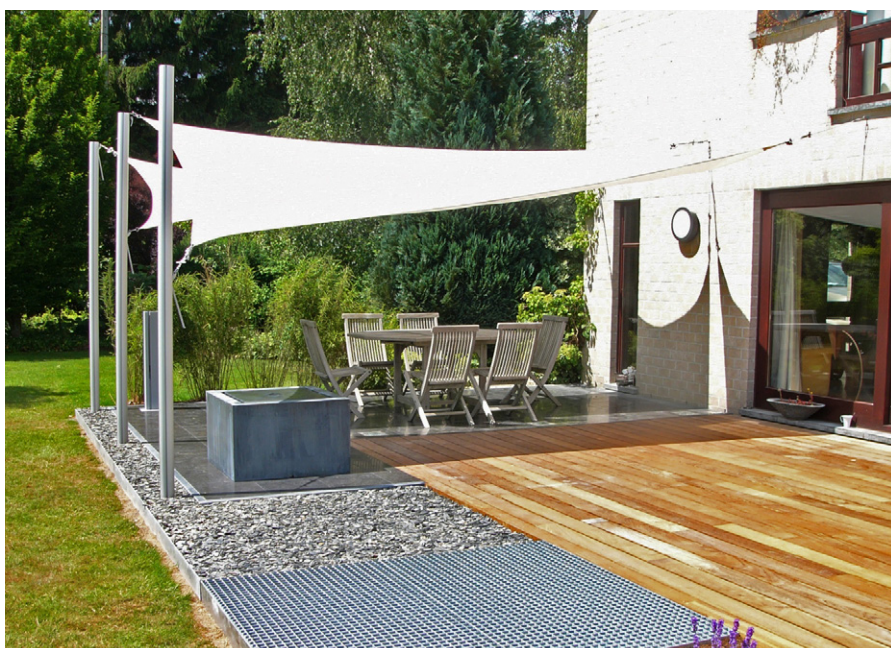
Čtvercové nebo trojúhelníkové sluneční plachty Ingenua s důmyslným upínacím systémem jsou k dostání v 10 barvách.

Aby sluneční plachta dostatečně stínila, je potřeba předem uvážit, jak během dne sluneční paprsky dopadají na terasu či na zahradu. Podle toho je pak potřeba vybrat plachtu vhodné velikosti. Měla by na všech stranách o kus přesahovat plochu, kterou má chránit před sluncem. Jen tak bude dostatečně stínit i při změnách polohy slunce; je pevně ukotvená, a proto se snadno nepřemístí podle potřeby jako slunečník. Musíte počítat se spádem 30 stupňů, proto je potřeba ji ukotvit například na fasádě dostatečně vysoko, aby na protější straně, například na přechodu mezi terasou a zahradou, nevisela příliš nízko a nebránila volnému pohybu. Sklon plachty zabraňuje hromadění dešťové vody, která zatěžuje uchycení a navíc může způsobit trvalé vyboulení tkaniny. Platí tedy zásada ukotvit jeden roh plachty níž než ostatní, aby dešťová voda mohla volně stékat.