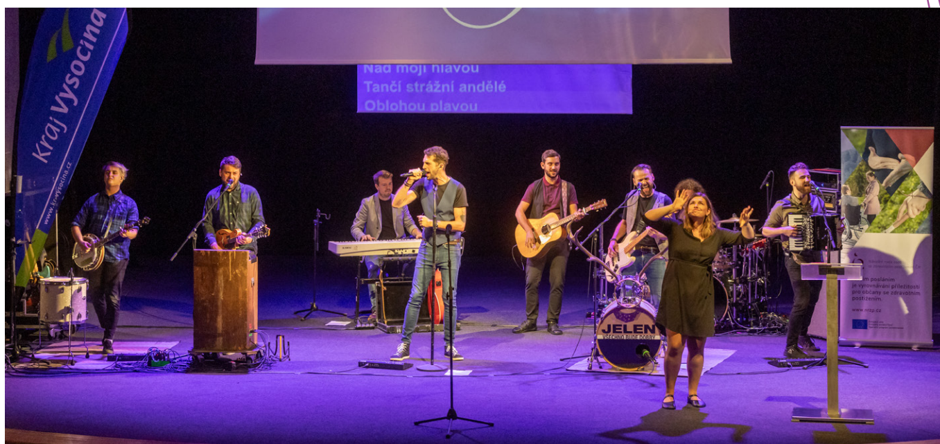
Hudební program zajistila skupina JELEN.