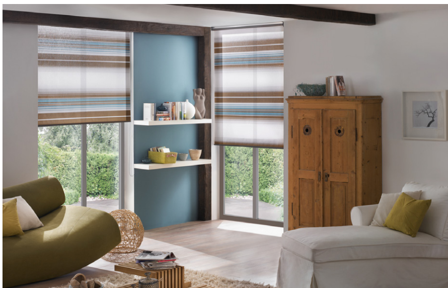
Příčně pruhované rolety místnost opticky rozšíří. ISOTRA

Převzato z časopisu Praktik, který najdete v elektronické podobě na www.casopispresinternet.cz . ■