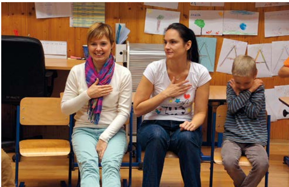
Přednáška „Seznamte se, prosím“ pro děti prvního stupně ZŠ o komunikaci s osobami se sluchovým postižením

V případě zájmu o spolupráci nás neváhejte kontaktovat. ♥