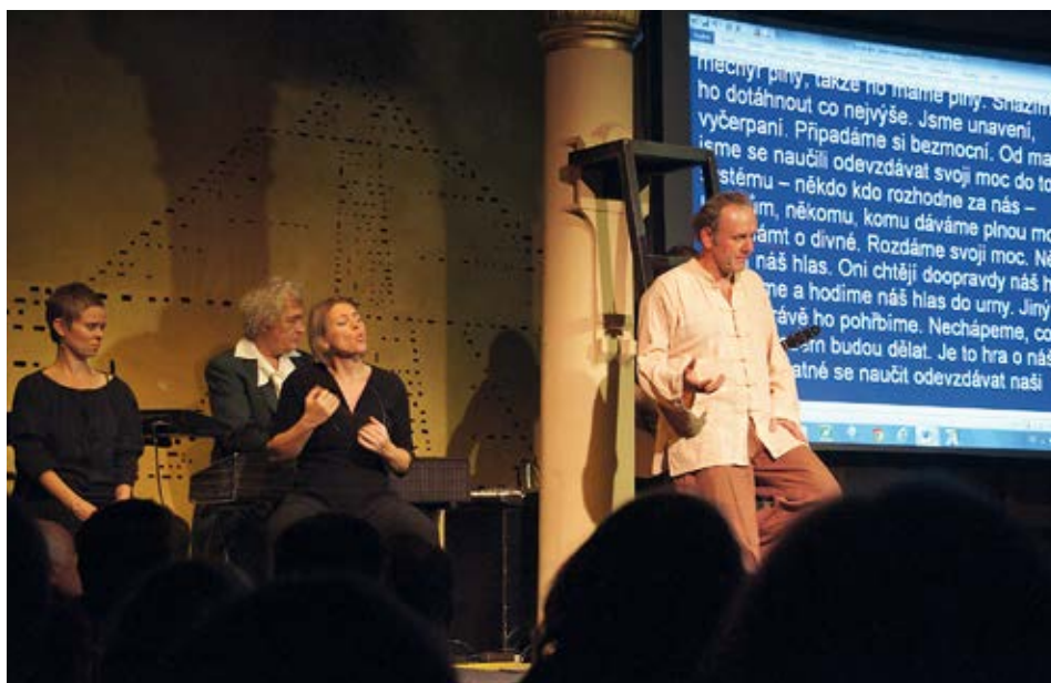
Divadelní představení „Čtyři dohody“, klub Lávka, Novotného lávka 1, Praha