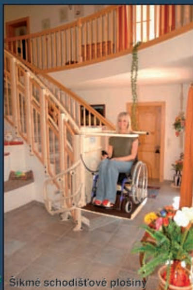
Šikmé schodišťové plošiny

Největší český výrobce zařízení pro překonávání schodišťových bariér s tradicí výroby již od roku 1992